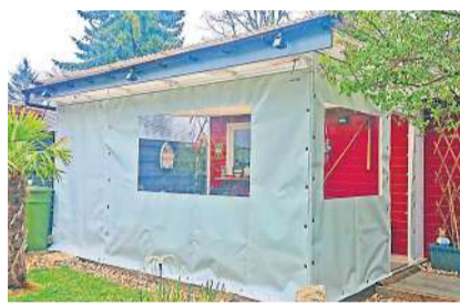
Blachen-Seitenwände können auf Kundenbedürfnisse angepasst werden.