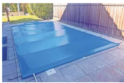
Starke, witterungsbeständige Schwimmbad-Abdeckungen. z.V.g.