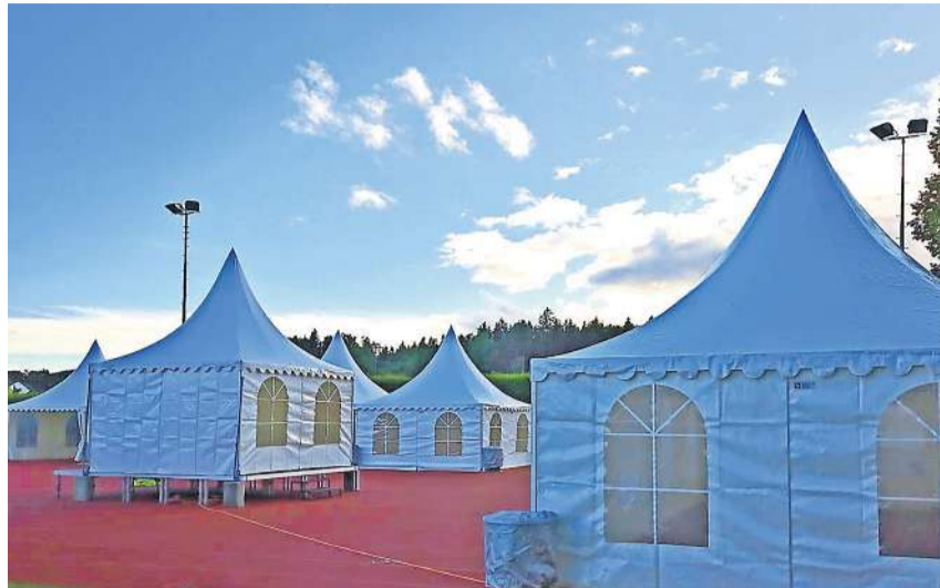
Für jeden Anlass kann das passende Zelt inkl. Festzubehör und Festmobiliar gemietet werden. z.V.g.

Egal ob Hochzeit, Firmenfest, Firmen-Apéro, Geburtstagsparty oder ein Vereinsnabend – das Unternehmen hat für jeden Anlass das passende Zelt inkl. Festzubehör und Festmobiliar. Individuelle Wünsche und Vorstellungen der Kunden bezüglich der Infrastruktur werden berücksichtigt und wo möglich umgesetzt. Der langjährige Zeltvermieter aus Hägglingen unterstützt seine Kunden optimal und kompetent bei der Planung des Anlasses.